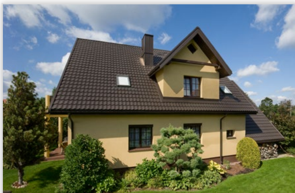
Finnera – blachodachówka modułowa. Wysokość całkowita [mm]: 52. Dł. modułu [mm]: 330. Szer. efektywna [mm]: 1140. Szer. całkowita [mm]: 1190. Dł. efektywna [mm]: 660. Dł. całkowita [mm]: 705. Pow. efektywna arkusza [m 2 /szt.]: 0,75. Wykończenie powierzchni: powłoka Purex. Kolory: czarny, grafitowy, ciemny brąz, czekoladowy brąz, wiśniowy, ceglasty. Gwarancja: 40 lat techniczna i 15 lat estetyczna. Cechy szczególne: produkt dostępny „od ręki”.