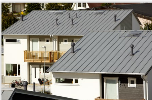
Classic – blacha na rąbek stojący. Zastosowanie: pokrycie dachowe. Wysokość rąbka [mm]: 32. Szerokość efektywna [mm]: 475. Szerokość całkowita [mm]: 505. Min. dł. [mm]: 800. Maks. dł. [mm]: 10 000. Wykończenie powierzchni: powłoka Pural mat, Purex, Poliester. Kolory: czarny, grafitowy, czekoladowy brąz. Gwarancja: 50 lat i 20 estetyczna. Cechy szczególne: blacha wytłaczana.