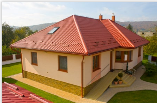
Monterrey FEB Forma – blachodachówka. Zastosowanie: pokrycie dachowe. Wysokość całkowita [mm]: 39. Dł. modułu [mm]: 350 mm. Szerokość efektywna [mm]: 1100. Szerokość całkowita [mm]: 1180. Min. dł. [mm]: 850. Maks. dł. [mm]: 8200. Wykończenie pow.: powłoka Purex, Poliester. Kolory: czarny, grafitowy, ciemny brąz, czekoladowy brąz, ceglasty, wiśniowy, zielony, oberzynna, burgund. Gwarancja: do 40 lat techniczna i 15 lat estetyczna.